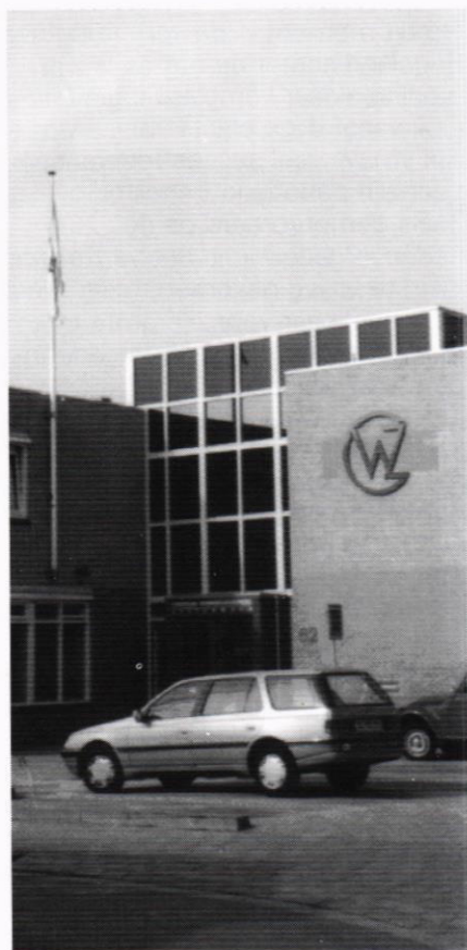
Illustratie omslag: wonen in ... een woonwagen

CWZ-INFORMATIEF is een uitgave van de Christelijke Woningbouwvereniging Zoetermeer ten behoeve van haar leden. Aan enige publicatie in dit blad kunnen geen rechten worden ontleend. Overnemen van artikelen met bronvermelding en uitsluitend na toestemming van de redactie. Voor suggesties, tips voor artikelen etc. wende men zich tot het redactie-adres.